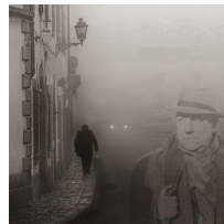
Recensione: Il Porto delle nebbie, di Georges Simenon - Edizioni gli Adelphi