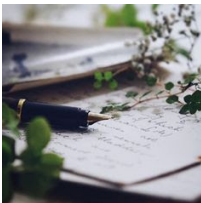
Recensione: Via dalla pazza folla, di Thomas Hardy - Fazi Editore