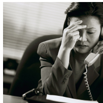
POTETE SCOMMETTERCI LE PALLE